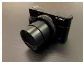
型落ちの Sony 製