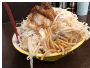
量も味も男気溢れる！

せっかくなので、普通のラーメンに野菜、油、ニンニク全て増しで注文して出てきたのがこちら。麺が出てくるまでかなり食べています。（高さは2/3くらいに）完全に二郎系。野菜がマウンテン盛り。お肉は野菜の下に埋もれています。