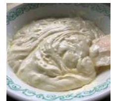
ミキサー不要です

30分焼いたら、プルンプルンなバイクドチーズケーキが出来上がりました。ここから冷まします。1時間ほどたったところでフライパンから出そうとした、その時、悲劇が起こりました。